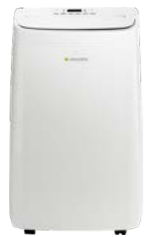
AAAP1200B Frío y Calor